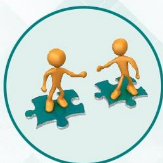
Analisi dei bisogni