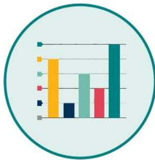
Piano d'azione per i corsisti