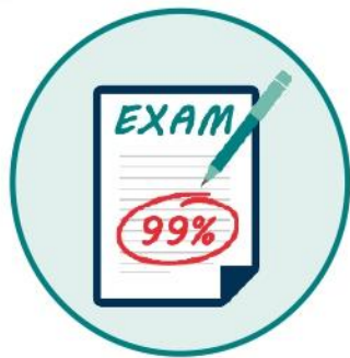
Esame di fine corso