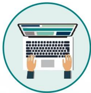
Somministrazione del corso