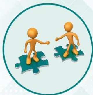
Analisi dei bisogni