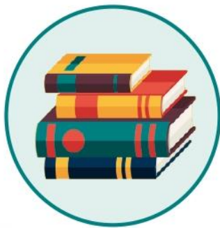
Pianificazione del corso